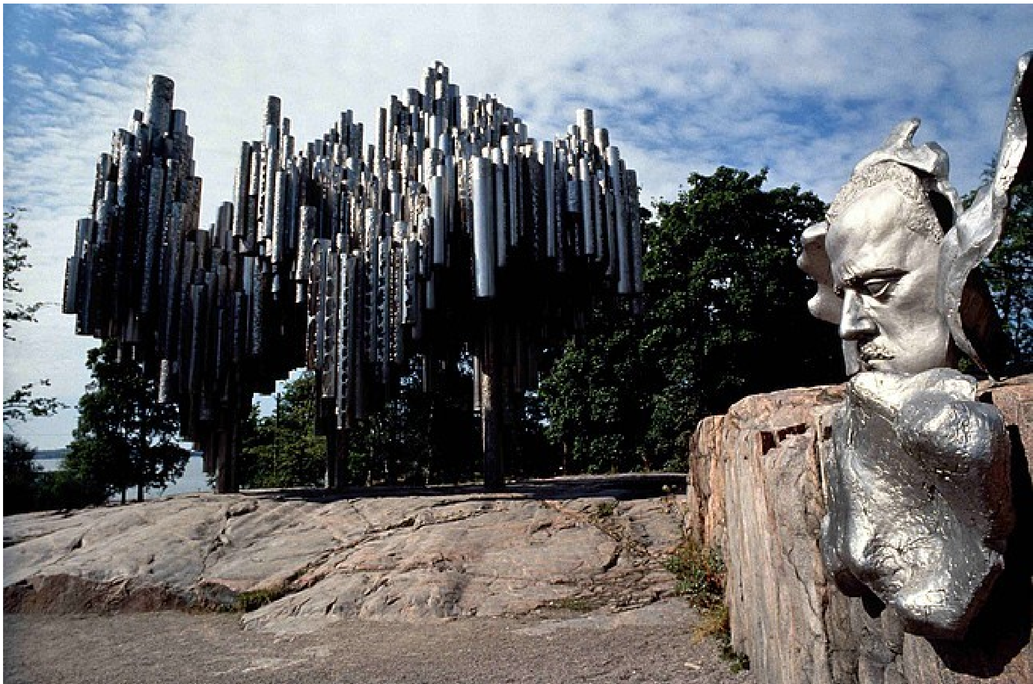
ALVAR AALTO scultura