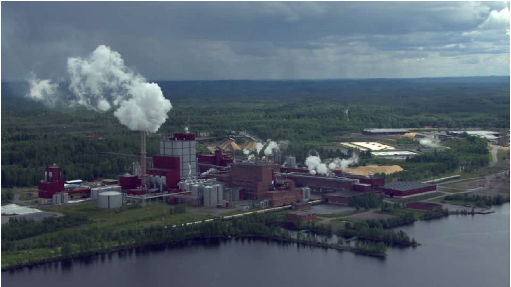
Cartiera / Carelia settentrionale / Finlandia

I comparti principali del settore secondario sono quello siderurgico, chimico, della lavorazione del legno, della cellulosa e della carta.